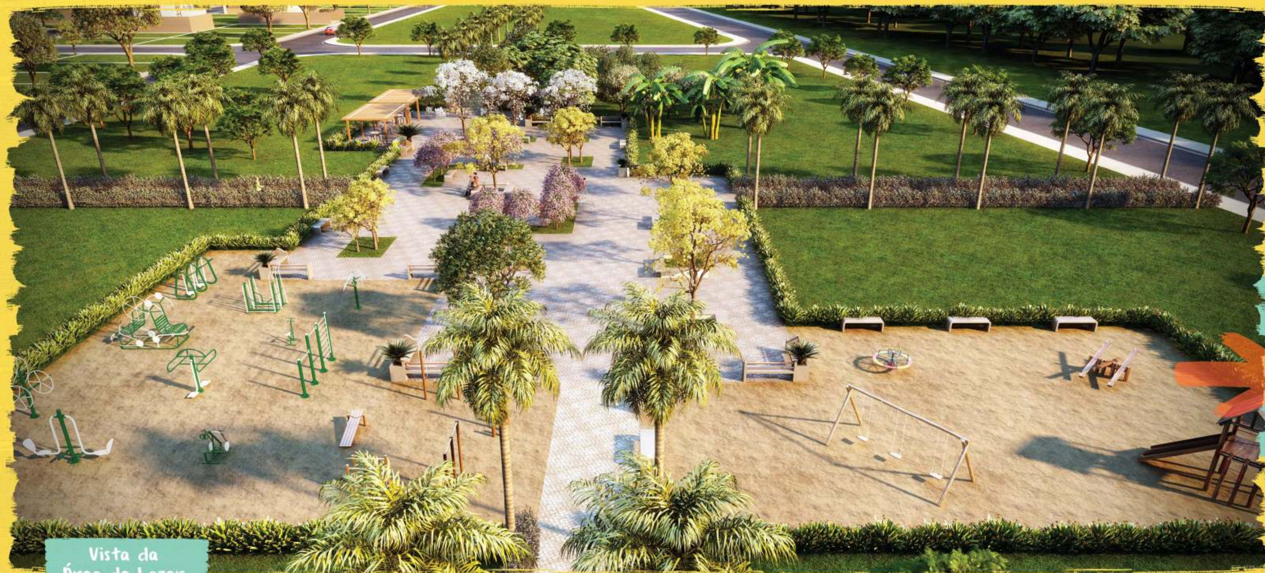
Vista da Área de Lazer