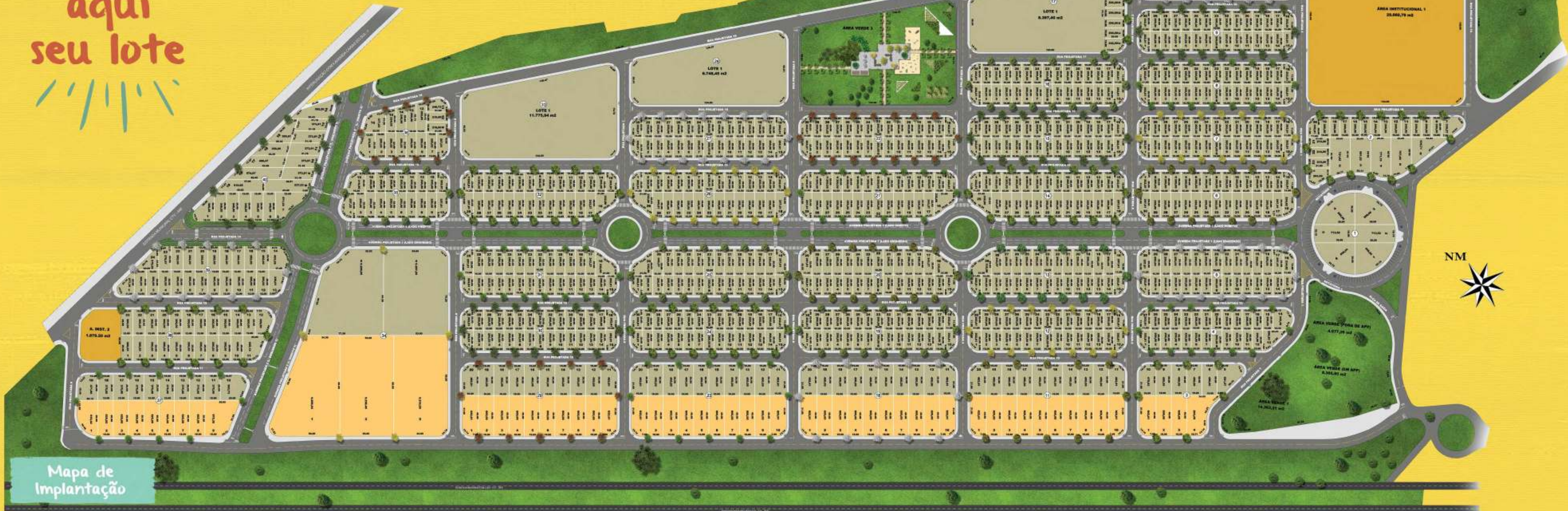
Mapa de Implantação