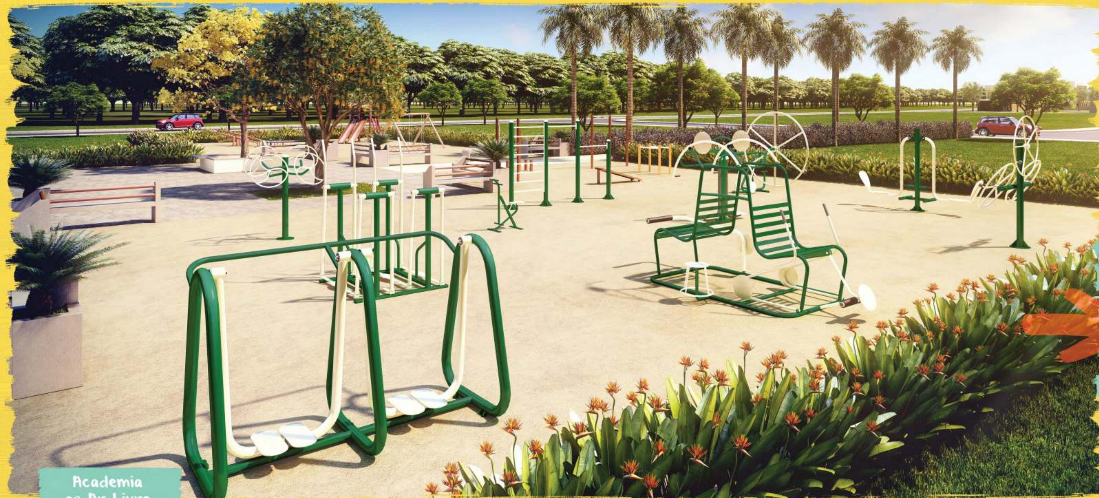
Academia ao Ar Livre